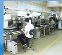
Elektromos szerelő- műhelyek hűtése