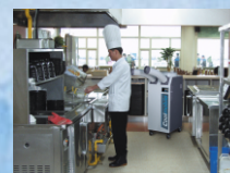
Vendéglői, üzemi konyhák hűtése